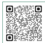
RWK • 355129 • 08/23

GESUNDNAH AOK Baden-Württemberg Die Gesundheitskasse.