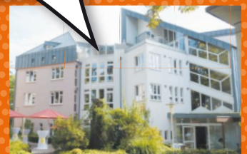
Vorstand, Beirat und Kuratorium arbeiten absolut ehrenamtlich!