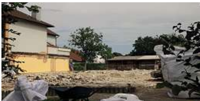
Von der alten Rheingießenhalle ist nichts mehr zu sehen. Sie wurde in den vergangenen Wochen abgetragen

Dort, wo fast 60 Jahre Rusterinnen und Ruster zu den unterschiedlichsten Anlässen zusammenkamen, wird nun ein neues Kapitel in der Ruster Geschichte aufgeschlagen. Denn in den letzten Wochen wurde die ehemalige Mehrzweckhalle vollständig abgetragen. Die Gemeinde schuf damit den notwendigen Raum für den Erweiterungsbau der Ruster Gemeinschaftsschule.