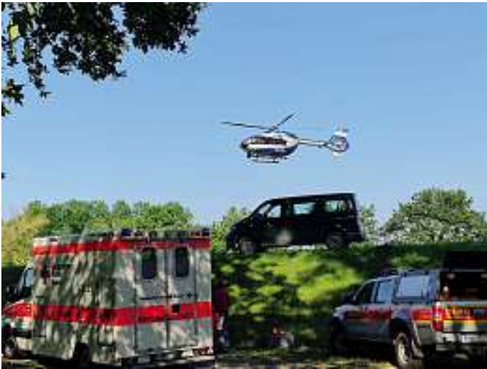
Auch Polizeihubschrauber waren im Einsatz, um die vermissten Personen aus der Luft ausfindig zu machen.