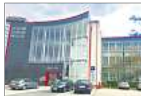
Zu Hause ist IMA Immobilien im Nestler-Carrée in Lahr.

Die IMA Immobilien GmbH ist ein inhabergeführtes, unabhängiges Unternehmen, das sich seit 1968 um alle Belange der Immobilienbranche kümmert. Vermittelt werden Grundstücke, Eigen-