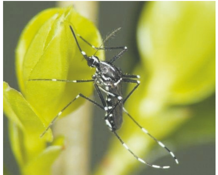
Asiatische Tigermücke ( Aedes albopictus )

Bitte geben Sie den Fundort an und hängen sie der E-Mail ein Foto an, auf dem möglichst die auffällige weiße Zeichnung auf dem Kopf und Rückenschild der Asiatischen Tigermücke zu erkennen ist. Auch die weiße Bänderung der Hinterbeine bis zu den Fußspitzen ist eindeutiges Erkennungsmerkmal.